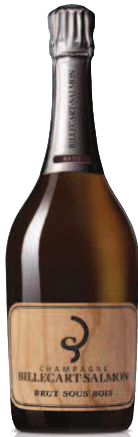
2. BILLECART-SALMON BRUT SOUS BOIS 750 ml – €86,50