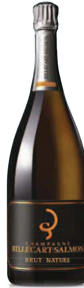
4. BILLECART-SALMON BRUT NATURE 750 ml – €71,00 1.5 L – €145,00