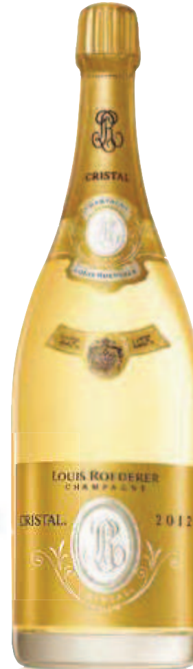
8. CRISTAL BRUT 2012 1.5 L – €665,00 9. CRISTAL BRUT 2009 3 L – €2.500,00