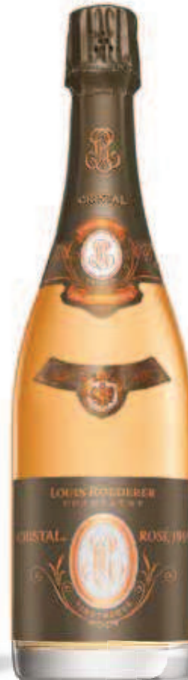
16. CRISTAL VINOtheQUE ROSÉ 1999 ή 2000 – 750 ml – €2.000,00 2000 ή 2002 – 1.5L – €3.900,00