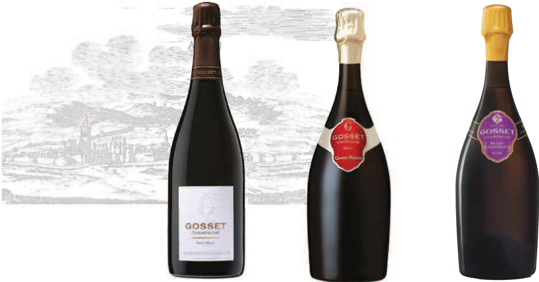
1. GOSSET EXTRA-BRUT NV 750 ml – €39,00

Gosset, ο παλιότερος οίκος της Καμπανίας στο Αγ από το 1584 και σήμερα στο Epernay