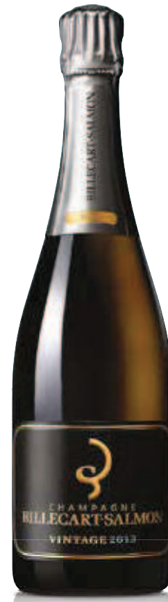
3. BILLECART-SALMON VINTAGE 2013 750 ml – €88,00