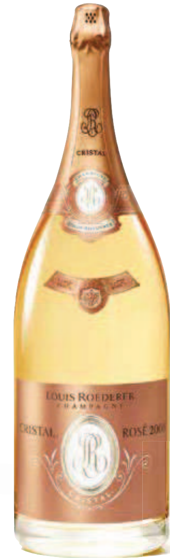
17. CRISTAL ROSÉ 2008 ή 2012 6 L – €14.800,00