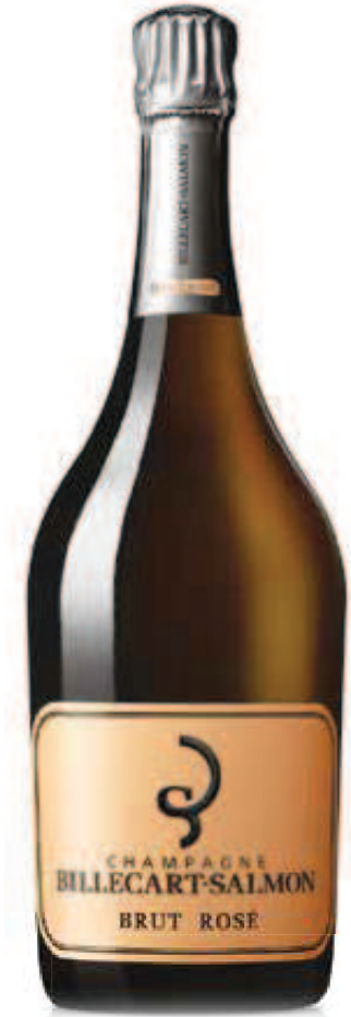
5. BILLECART-SALMON BRUT ROSÉ NV 750 ml – €81,00 1.5 L – €181,50