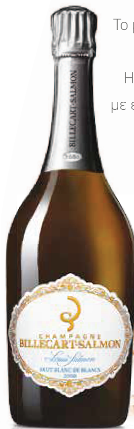
7. BILLECART-SALMON BRUT BLANC DE BLANCS CUVÉE LOUIS SALMON 2009 750 ml – €165,00

Το μνημείο της Αψίδας του Θριάμβου, στο κέντρο του Παρισιού. Η κατασκευή του ξεκίνησε το 1806 με εντολή του Ναπολέοντα Βοναπάρτη και ολοκληρώθηκε το 1836.