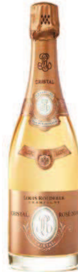
10. CRISTAL ROSÉ BRUT 2014 750 ml – €570,00 11. CRISTAL ROSÉ BRUT 2013 1.5 L – €1.300,00 12. CRISTAL ROSÉ BRUT 2008 ή 2009 – 3 L – €5.350,00