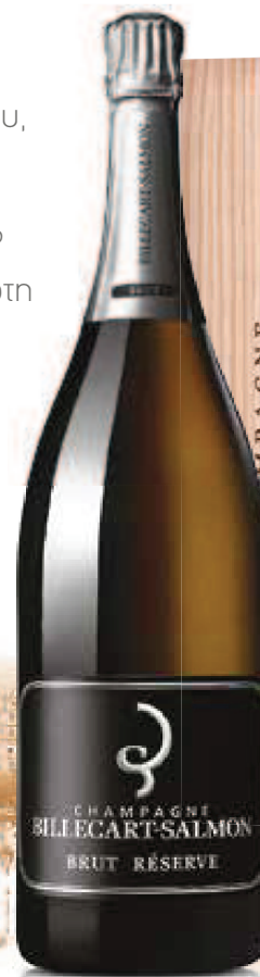
8. BILLECART-SALMON BRUT RÉSERVE σε ξύλινη κασετίνα 3 L – €252,00