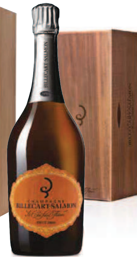
9. BILLECART-SALMON CLOS SAINT-HILAIRE BRUT 2005 ή 2006 σε ξύλινη κασετίνα 750 ml – €470,00