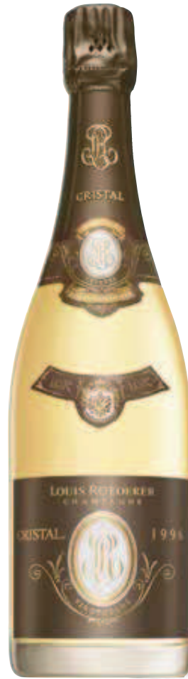
13. CRISTAL VINOtheQUE 1995 – 1.5 L – €1.950,00

Όλοι όσοι έχουν δοκιμάσει Cristal έχουν υποκλιθεί στην ποιότητά της. Αυτοί όμως που την κατανοούν σε βάθος πάντα σχολιάζουν πως, για να νιώσεις πραγματικά το μεγαλείο της Cristal, πρέπει να τη δοκιμάσεις αφού έχει κλείσει τα εικοστά γενέθλιά της . Το θέμα είναι πως ελάχιστοι οινολάτρες έχουν ζήσει την εμπειρία. Η σειρά Vinothèque έρχεται να δώσει αυτή ακριβώς την ευκαιρία. Η ομάδα της Louis Roederer, όταν μια εσοδεία της Cristal βρίσκει τον δρόμο της προς την αγορά, κρατάει μια ποσότητα (κλεισμένη ήδη με τον τελικό φελλό) και την κυκλοφορεί ως Vinothèque τουλάχιστον μία δεκαετία αργότερα.