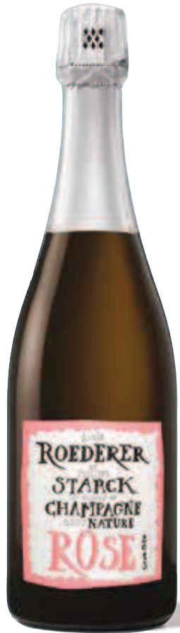
6. LOUIS ROEDERER ET PHILIPPE STARCK Brut Nature Rosé 2015 750 ml – €96,50