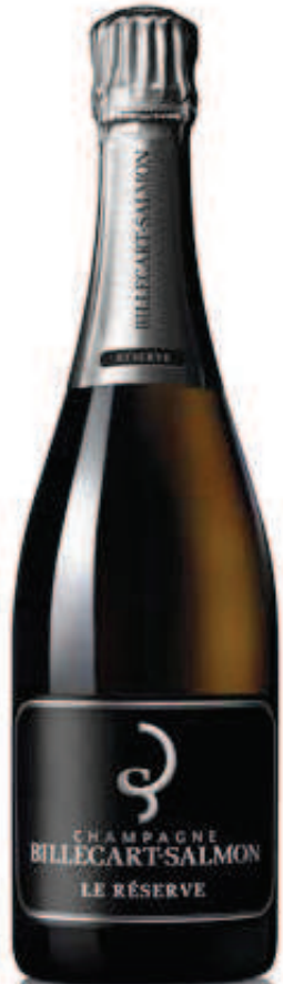
1. BILLECART-SALMON LE RÉSERVE 750 ml – €49,50

Ο οίκος ιδρύθηκε το 1818 από τον Nicolas François Billecart (1794-1858) και τη σύζυγό του Élisabeth Salmon (1797-1860).